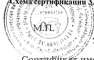
Схема сертификации З.

Место нанесения знака соответствия: по ГОСТ Р 50460-92 в сопроводительной документации